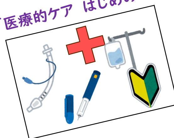
「医療的ケア はじめの一步」

千葉県総合教育センターの 研修事業（希望研修）では 先生方の日々の不安や悩みに 寄り添う学びを提供しています