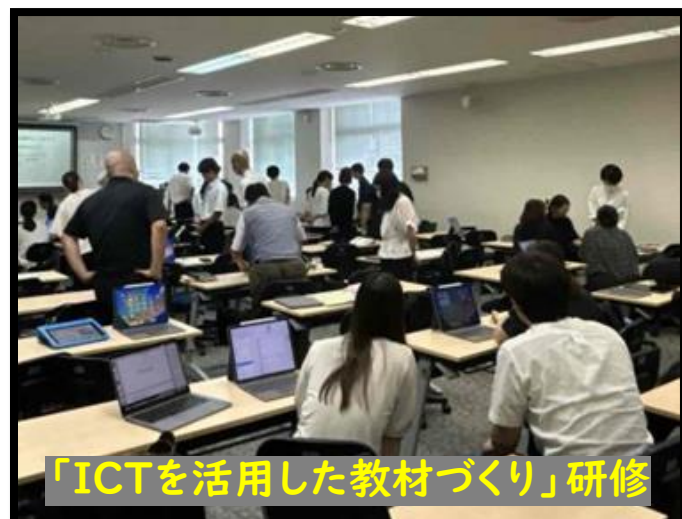
「ICTを活用した教材づくり」研修