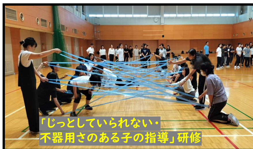
「じっとしていられない・ 不器用さのある子の指導」研修