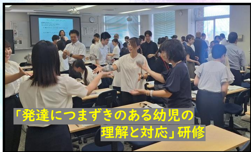
「発達にさまざまな 理解と対応」研修